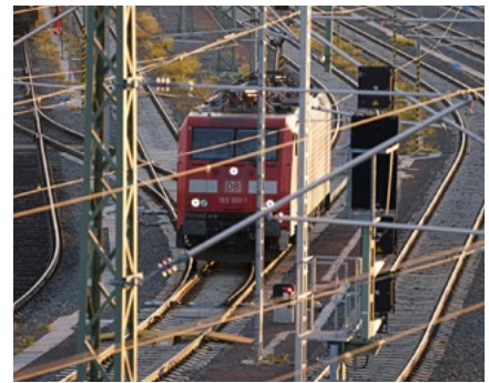
Eine DB Cargo Ellok Baureihe 189 rollt zum Einsatz.