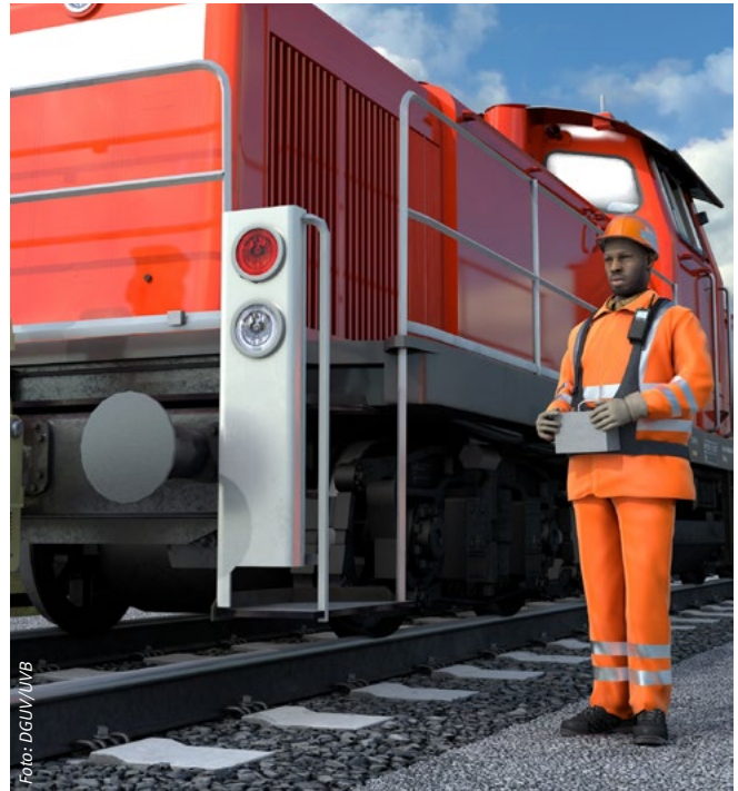
Lokrangierführer mit Persönlicher Schutzausrüstung

Der Unternehmer erhält umfangreiche Hinweise, was er bei der Auswahl der PSA im Rahmen der Gefährdungsbeurteilung berücksichtigen muss, sowie eine beispielhafte Zusammenstellung der grundsätzlich bereitzustellenden PSA für die einzelnen Funktionen. Der